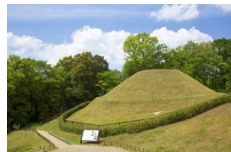
▲高松塚古墳

5月に一般公開が予定されていましたが、新型コロナウイルスの感染拡大の影響で中止となりました。